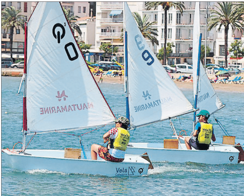
L'esport Blau Escolar es desenvolupa conjuntament amb la Federació Catalana de Vela