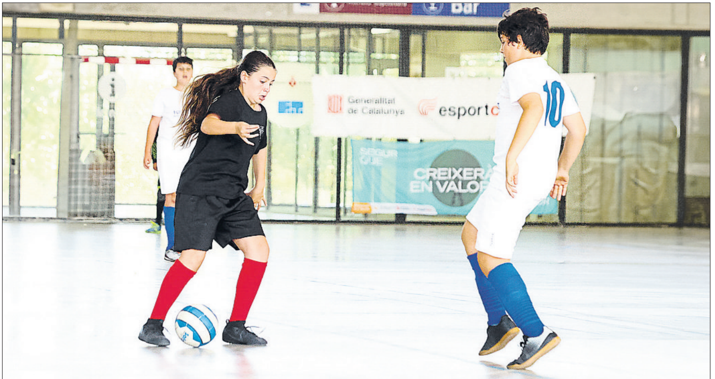
A diferència d'altres àmbits esportius les competicions escolars es conceptualitzen com activitats extra-escolars on és més important la participació que el resultat