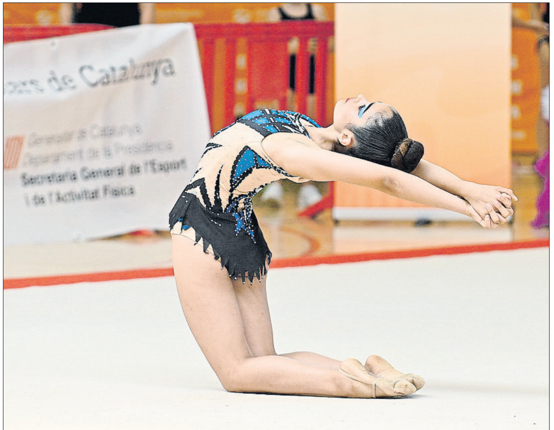
L'esport escolar és esport per a tots els infants i adolescents. És una de les màximes expressions d'aquesta premissa

Formació integral de l'alumnat. I què és? Tots els aspectes que contribueixen al creixement i aprenentat-