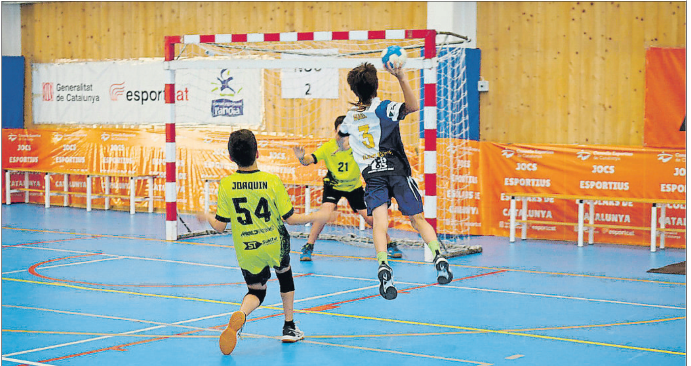
Al territori de Barcelona és on hi ha el major nombre de Consells Esportius i on es registren les majors actuacions i participacions